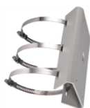
DS-1275ZJ Vertical pole mount